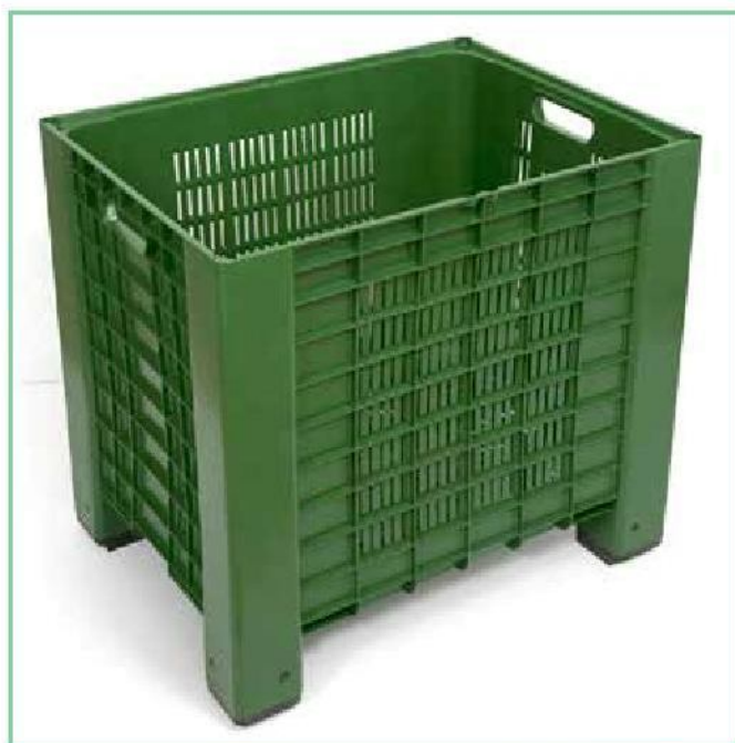
Aperto / Perforated

Provided by the customer or carried out with our vehicles (load capacity 300 items)