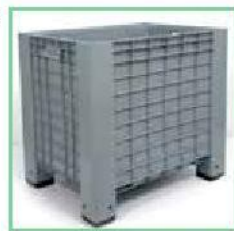
Chiuso / Solid